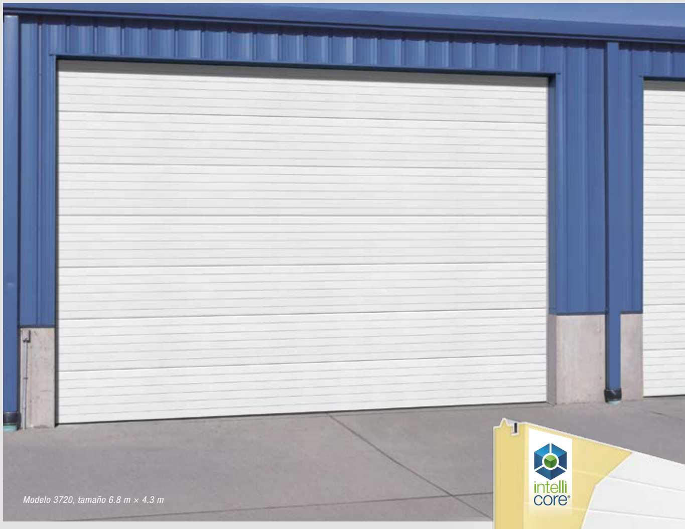
Modelo 3720, tamaño 6.8 m x 4.3 m